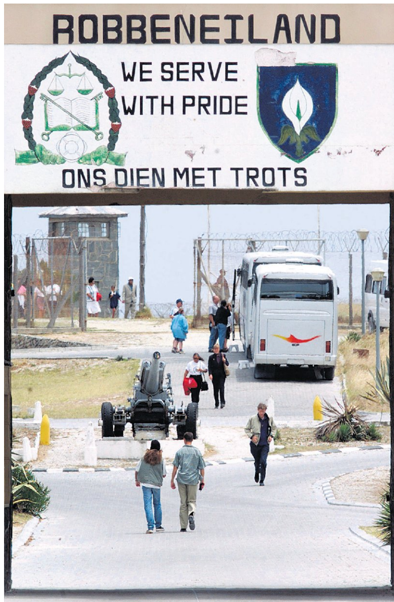
Robbeneiland trekt toeristen omdat Mandela er gevangen zat.

eersten op het (toen nog onbewoonde) Robbeneiland. Later kwamen de Nederlanders, die er een bevoorradingsstation voor VOC-schepen begonnen en een gevangenis vestigden. In de Engelse tijd was het eiland een leprozenkolonie. In 1961 vestigde het Zuid-Afrikaanse apartheidregime er de beroemde, zwaar bewaakte gevangenis voor politiek strijders. Sinds 1999 staat het hele eiland op de werelderfgoedlijst van Unesco.